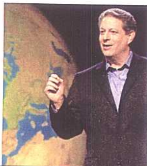
KLIMA-PAPST Mehr als 1000 Vorträge hielt Al Gore über den Treibhauseffekt. Die Belohnung: Für den Film zum Thema gab's 2007 einen Oscar